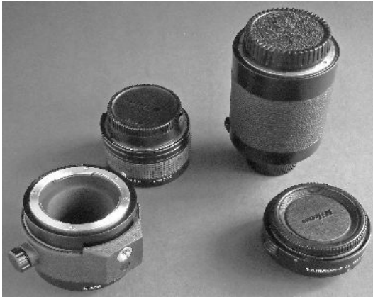
Konverter 1,4-fach, 2-fach und Spezialzwischenring Nikon