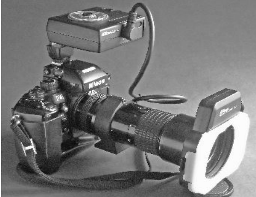
"Kleine Jagdausrüstung" mit Nikon F4, 4,0/200mm und SB21

Das Generalhilfsmittel gegen viele der eben beschriebenen Fallstricke stellt die Blitzbeleuchtung dar. Bei den heute üblichen Belichtungsmessmethoden wird der Blitz von der Innenmessung der Kamera gesteuert. Auch die gleichzeitige Ansteuerung mehrerer Blitzer ist so möglich. Dies ermöglicht eine außerordentlich einfache Handhabung. Man kann sich so, je nach Bedarf und Geldbeutel sein Licht so zusammenstellen, das alle früher üblichen Klippen elegant umschifft werden. Dennoch lohnen sich einige grundsätzliche Überlegungen, auch wenn sie zunächst kompliziert erscheinen.