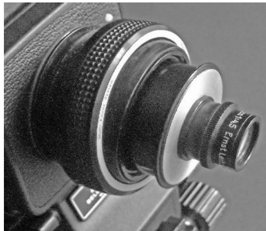
Lupenobjektiv am Balgen mit Schwenktubus Zörk

Will man die Kosten etwas begrenzen, kann man mit gutem Erfolg auch Vergrößerungsobjektive als Lupenoptiken verwenden. Bei vielen Digitalumsteigern ist das, weil der Vergrößerer arbeitslos geworden ist, ohne Verlust an Lebensqualität möglich. Man muss nur beachten, dass die oft vorhandene Beleuchtung der Blendenzahl innen abgeklebt wird, sonst hat man unerwünschtes Streulicht im System. Schon bei geringer Ablendung sind derartige Linsensysteme echten Lupenobjektiven ebenbürtig. Allerdings sind Brennweiten unter 35 mm kaum zu bekommen. Auch umgekehrte Linsen aus 8mm-Filmkameras kann man so verwenden. Hier sind die festen Brennweiten zu bevorzugen. Man findet sie billig auf vielen Fotoflohmärkten und -Börsen; die Anpassung an die Kamera erfordert aber das Hinzuziehen eines Feinmechanikers.