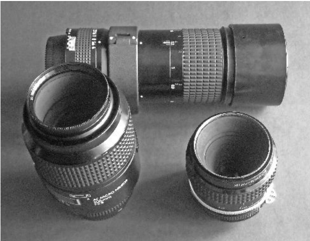
Makroobjektive Nikon 55mm, 105mm und 200mm

Hier handelt es sich um ausgesprochene Spezialobjektive. Sie sind in ihrer gesamten Auslegung auf die Verwendung in der Nahfotografie zugeschnitten. Dazu gehört die Möglichkeit, sie bis auf geringe Entfernungen zu fokussieren. Die Objektivfassungen weisen dazu besondere, trickreiche Gestaltungen auf. Bei vielen ist so der Bereich bis zur Abbildung in natürlicher Größe zugänglich. Auf der optischen Seite sind Makroobjektive so ausgelegt, dass sie eine sehr gute Bildfeldebnung bei gleichzeitig hoher Schärfe und hohem Kontrast über das gesamte Bildfeld bis an die untere Einstellgrenze bieten. Erkauft werden diese Eigenschaften unter anderem durch Verzicht auf besonders hohe Öffnungsverhältnisse. Da man aus gestalterischen Gründen aber ohnehin meist mit weit geschlossener Blende arbeitet, spielt dies in der Praxis keine entscheidende Rolle. Makroobjektive verfügen über einen stark erweiterten Einstellbereich, der natürlich auch die Fokussierung auf Unendlich zulässt. Damit sind sie universell einsetzbar.