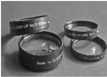
Vorsatzachromat 55 mm und 49 mm

Eine elegante und vor allem preiswerte Möglichkeit, in die Nahfotografie vorzudringen, stellen Vorsatzlinsen und -Achromate dar. Dies sind Linsen oder Linsensysteme, die wie Filter ins Objektiv geschraubt werden, dabei Brennweiten-verkürzend wirken und so bei gleich gebliebenem Verstellweg (Auszug) des Objektivs ein näheres Herangehen ans Motiv gestatten. Die Vorsatzlinsen sind eingliedrig aufgebaut und entsprechend preiswert. Die Vorsatzachromate sind in der Regel zweigliedrig zusammengestellt und liefern eine deutlich bessere Abbildungsqualität als die einfachen Linsen. Man sollte sie, wenn sie auch teurer sind, diesen einfachen Linsen bevorzugen. Ihre wirksame Brennweite wird meist in der Maßeinheit Dioptrie (dptr) angegeben, die bei Optikern üblich ist.