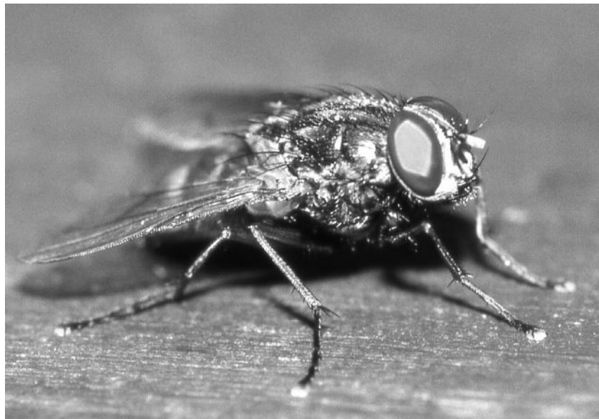
Käsefussfliege (Musca domestica limburgensa)

von Herbert Neumann, Dipl.Ing IWE Juli 2012