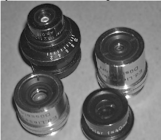
Lupenobjektive von Zeiss, Leitz u. Leisegang

Entsprechend ihrer besonderen Auslegung sind auch ihre Kosten ungewöhnlich hoch. Für allgemeine fotografische Zwecke sind sie im Gegensatz zu Makroobjektiven, untauglich. Auch für die mobile Fotografie im Freiland sind sie praktisch unbrauchbar. Die Anwendung geschieht meist an speziellen Stativen, einer Reprosäule oder einem Mikroskopstativ zusammen mit besonderen Beleuchtungseinrichtungen. Die erzielbaren Abbildungsmaßstäbe reichen so bis etwa 20 : 1. Diese Sonderoptiken leisten hier hervorragendes.