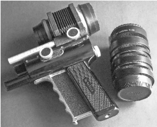
Zwischentubus und Schnellfocusbalgen